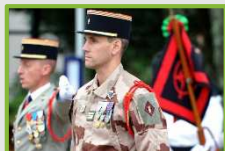
Officier / pilote de l'armée